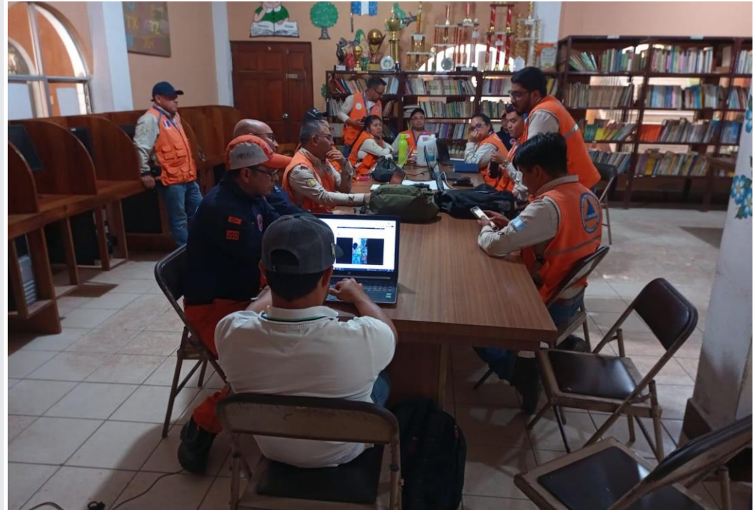
Reunión COE municipal, San Juan Ixcoy, Huehuetenango

El informe será trasladado al COE municipal para la socialización con las instituciones encargadas de dar respuesta a la emergencia.