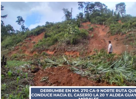
DERRUMBE EN KM. 270 CA-9 NORTE RUTA QUE CONDUCE HACIA EL CASERÍO LA 20 Y ALDEA GUAYTAN, MORALES