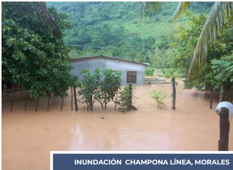
INUNDACIÓN CHAMPONA LÍNEA, MORALES