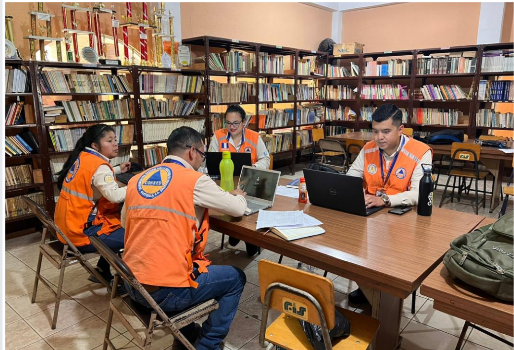
Municipio de Santa Cruz Barillas, Huehuetenango

Para el día de hoy el Equipo de Intervención Estratégica -EIE- continúa trabajando de manera conjunta con las autoridades territoriales con manejo de información interinstitucional del trabajo en campo realizado por los equipos evaluadores de daños y la consolidación de la información a través de cuadro de situación a fin de garantizar las acciones de respuesta y administración de la emergencia del COE Municipal.