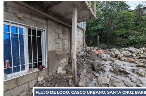
FLUJO DE LODO, CASCO URBANO, SANTA CRUZ BARILLAS