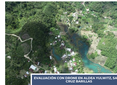
EVALUACIÓN CON DRONE EN ALDEA YULWITZ, SANTA CRUZ BARILLAS