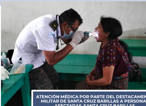
ATENCIÓN MÉDICA POR PARTE DEL DESTACAMENTO MILITAR DE SANTA CRUZ BARILLAS A PERSONAS AFECTADAS, SANTA CRUZ BARILLAS