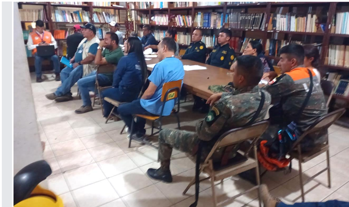
Municipio de Santa Cruz Barillas, Huehuetenango