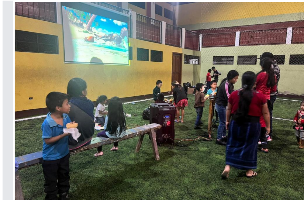
Actividades lúdicas, Santa Cruz Barillas, Huehuetenango