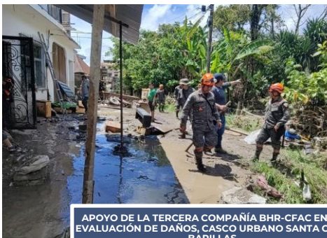
APOYO DE LA TERCERA COMPAÑÍA BHR-CFAC EN LA EVALUACIÓN DE DAÑOS, CASCO URBANO SANTA CRUZ BARILLAS