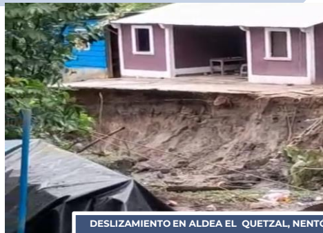
DESPLIZAMIENTO EN ALDEA EL QUETZAL, NENTÓN