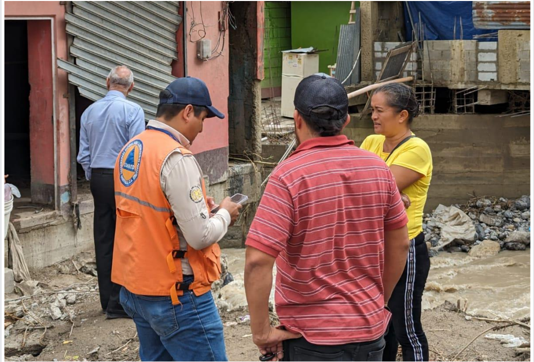
Casco urbano Santa Cruz Barillas, Huehuetenango

El día de ayer se realizaron 24 evaluaciones a viviendas, por lo que el equipo de recuperación está generando la actualización correspondiente.