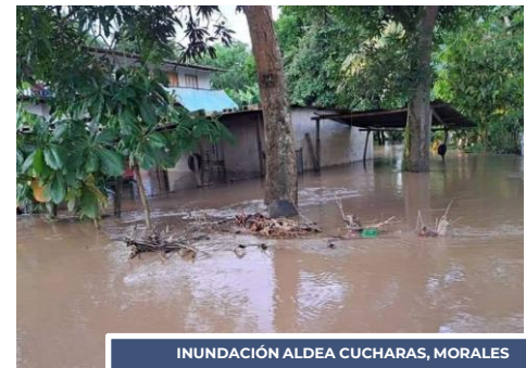
INUNDACIÓN ALDEA CUCHARAS, MORALES