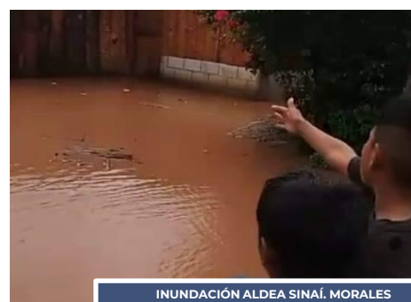
INUNDACIÓN ALDEA SINÁI, MORALES