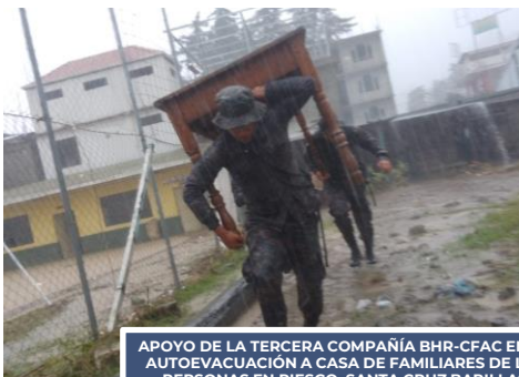
APOYO DE LA TERCERA COMPAÑÍA BHR-CFAC EN LA AUTOEVACUACIÓN A CASA DE FAMILIARES DE LAS PERSONAS EN RIESGO, SANTA CRUZ BARILLAS