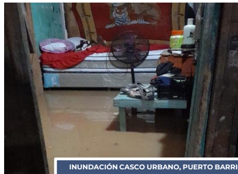
INUNDACIÓN CASCO URBANO, PUERTO BARRIOS