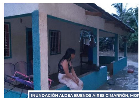
INUNDACIÓN ALDEA BUENOS AIRES CIMARRÓN, MORALES