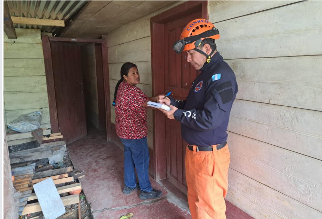
Reconocimiento de áreas afectadas, Santa Cruz Barillas, Huehuetenango

Para el día de hoy continuarán realizando acciones de reconocimiento en áreas del casco urbano de Santa Cruz Barillas y la coordinación para la realización de la evaluación de sitio que determinará el nivel de riesgo a deslizamiento de un cerro conjunto en las zonas del casco urbano, debido a la saturación de suelos.